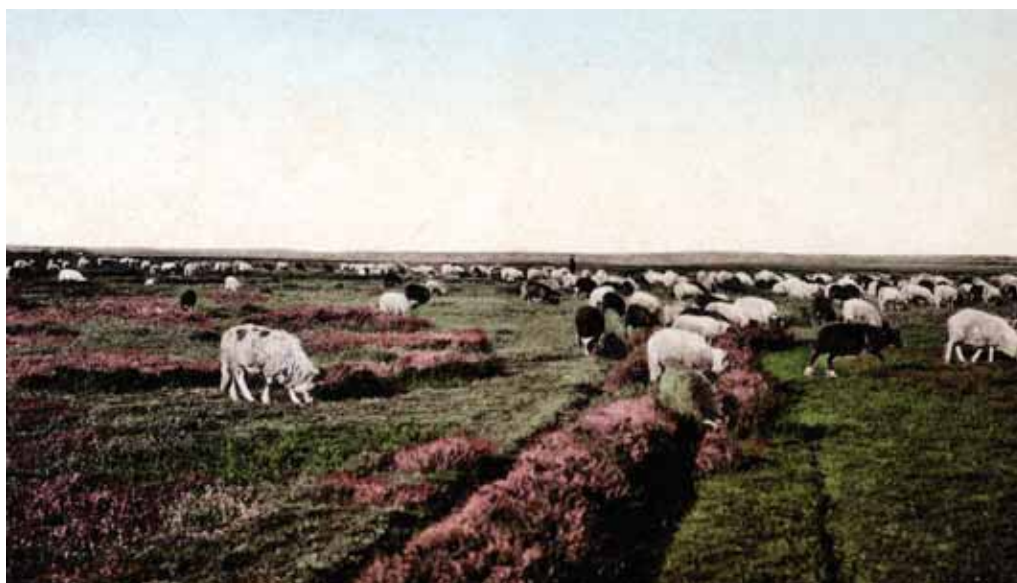
Schape op de heide, rond 1920.

waard op het Molenveld tussen Odoorn en Exloo, ook heden ten dage nog een prachtig heideveld. Een restant heide is ook nog te zien ten noordoosten van Odoorn. Veel kleiner dan het Molenveld, maar in archeologisch opzicht zeer interessant vanwege het voorkomen van een grafheuvel uit de prehistorie en de restanten van een eeuwenoud karrenpad. De grafheuvel is te dateren in het Neolithicum (Nieuwe Steentijd) of in de Bronstijd en moet ergens tussen 2500 en 1100 v. Chr. zijn opgeworpen. Het karrenpad stamt uit de tijd dat er over de heide nog geen gebaande wegen liepen. De voerman stuurde zijn trekdiere simpelweg de uitgestrekte vlakte tussen Valthe, Exloo en Odoorn op, anderen volgden dit voorbeeld en zo ontstond er een soort pad, eigenlijk niet veel meer dan een wagenspoor. Bij slecht weer werd dit spoor onbegaanbaar en kozen de voerlieden een route ernaast. Zo ontstond er in de loop der eeuwen een 'bundel' van wel twaalf karrensporen naast elkaar. Later werd dit pad vervangen door de bekende kasseienweg van Valthe naar Exloo.