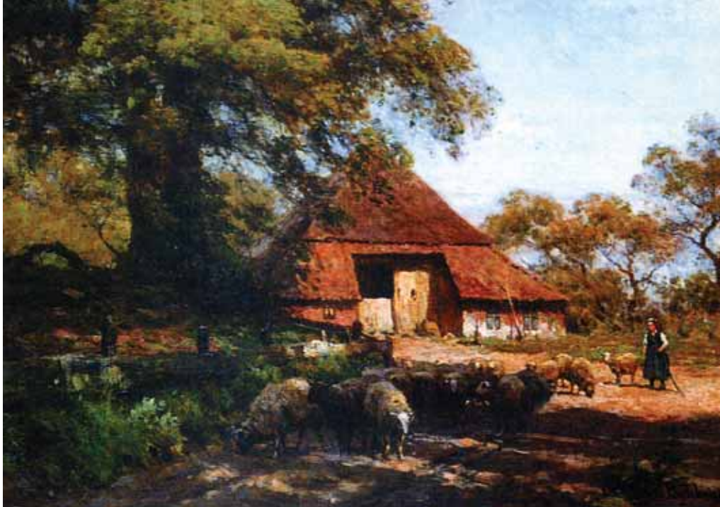
Bij de schaapskooi in Exloo van Julius Jacobus van de Sande Bakhuijzen. (Collectie Drents Museum, Assen, olieverf op doek 105 x 89 cm)

zegt elk hun eigen schaapskudde(n). Eeuwenlang was de heide vrij en ongedeeld gebied en ook toen in de 19 e eeuw