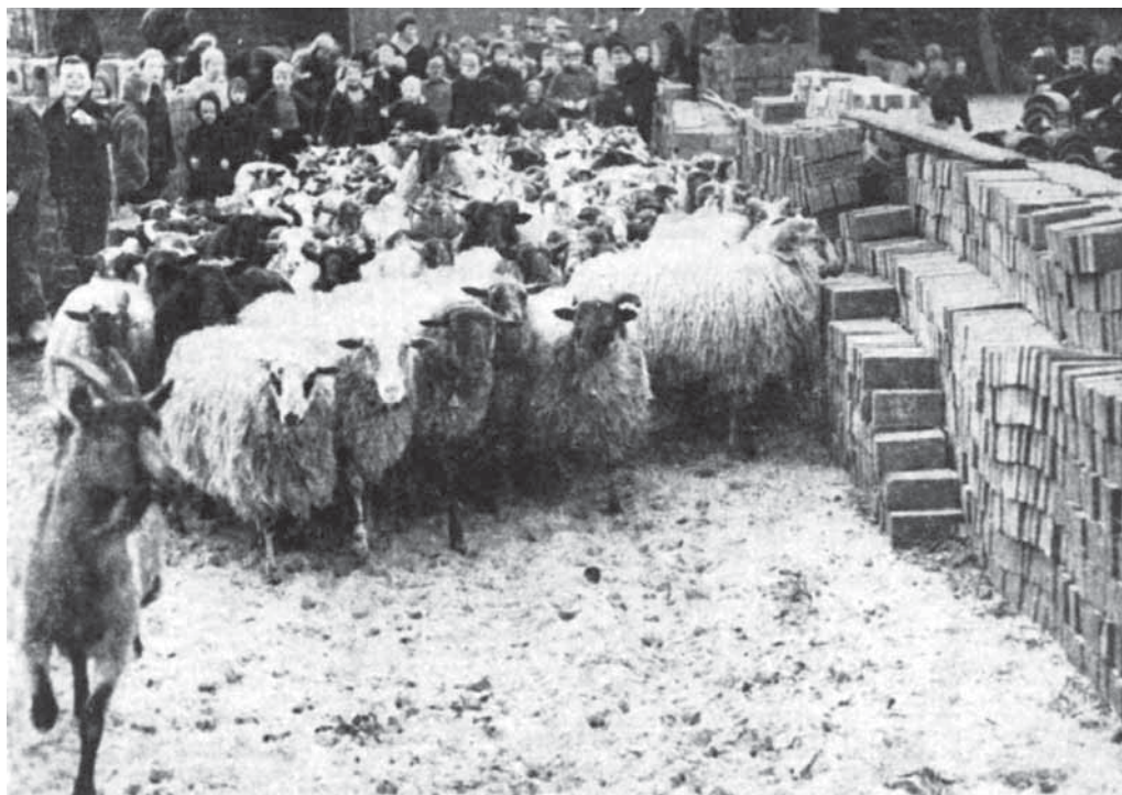
Krantenfoto bij het artikel over de Larense kudde.

op, huppelen het terrein van gemeentewerken op, om kennis te maken met de Exloër jeugd.