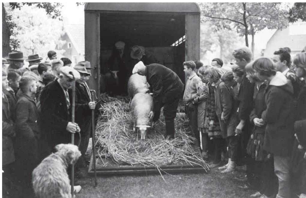
De aankomst van de schapen uit Ruinen.