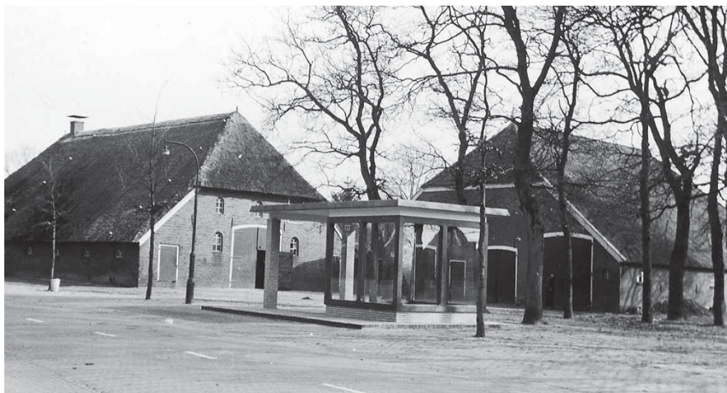
De boerderij, midden jaren vijftig, aan de Hoofdstraat met rechts de schuur, die later als schaapskooi in gebruik werd genomen. Voor op de foto de fraaie bushalte.

Nadien wekt de voorzitter de raadsleden op, die nog geen jaarlijkse bijdrage heb-